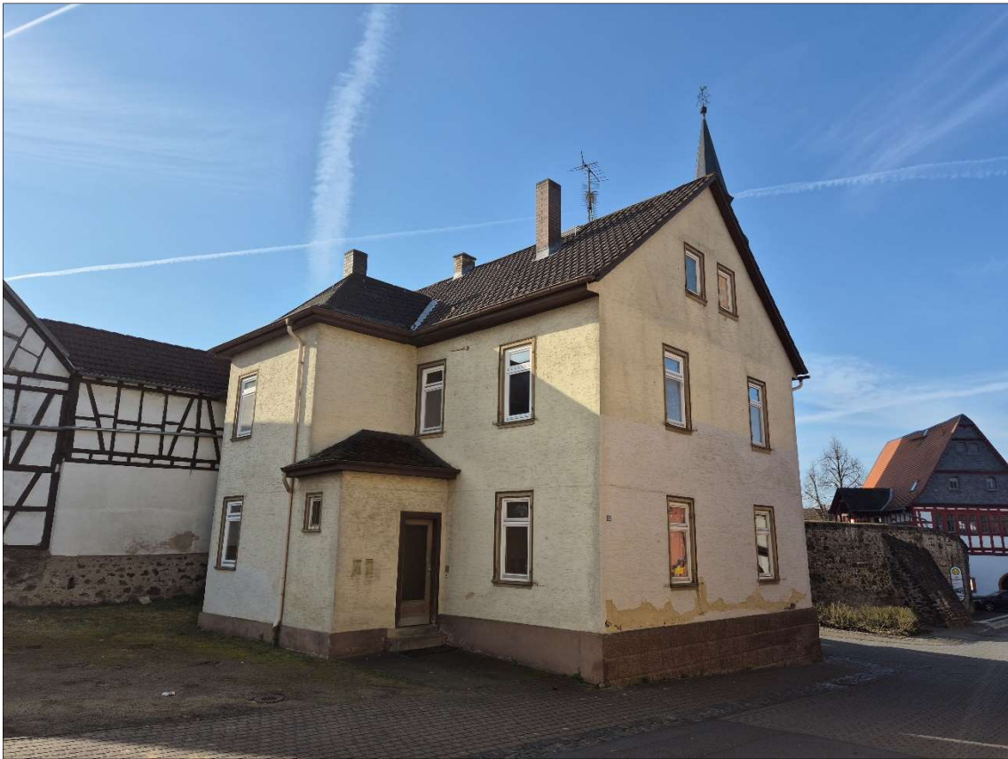
Ansicht von Hauptstraße aus / Ansicht Norden