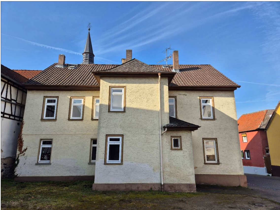
Ansicht Hofseite / Ansicht Osten