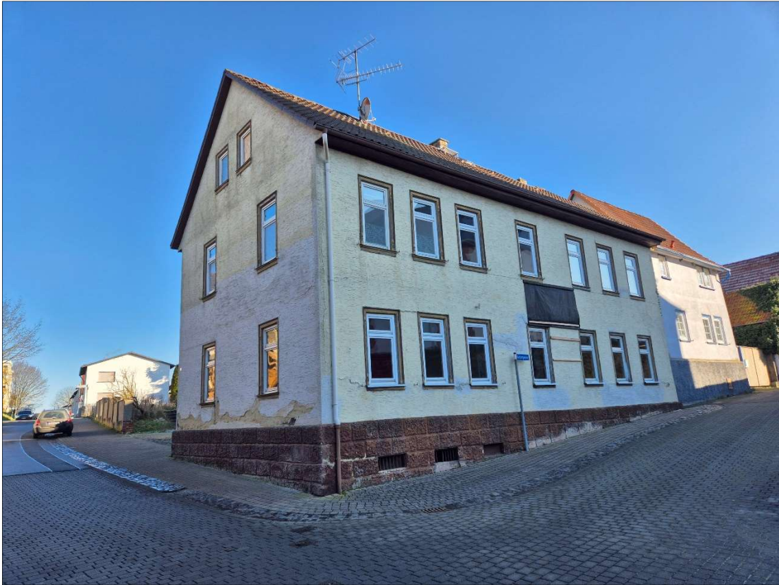
Ansicht Hauptstraße / Hintergasse, Ansicht Westen