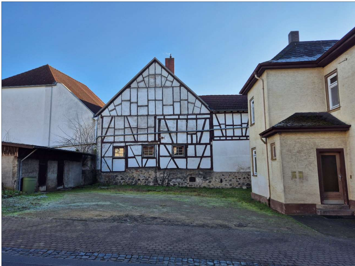
Hoffläche und Schuppen