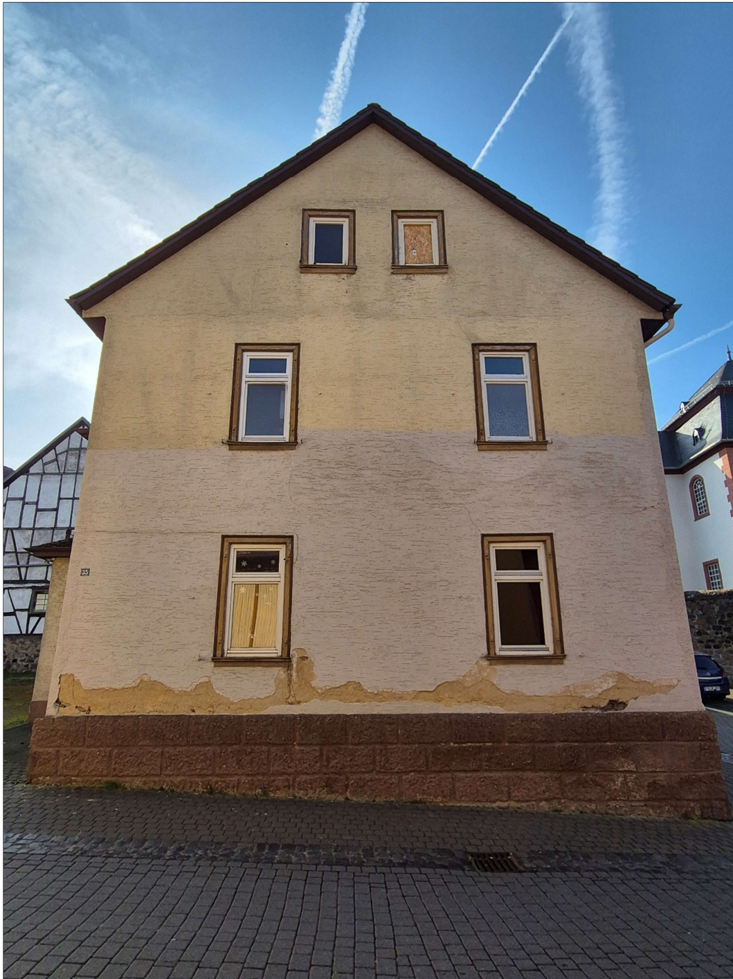
Giebelansicht Hauptstraße / Ansicht Nord-Nord-West